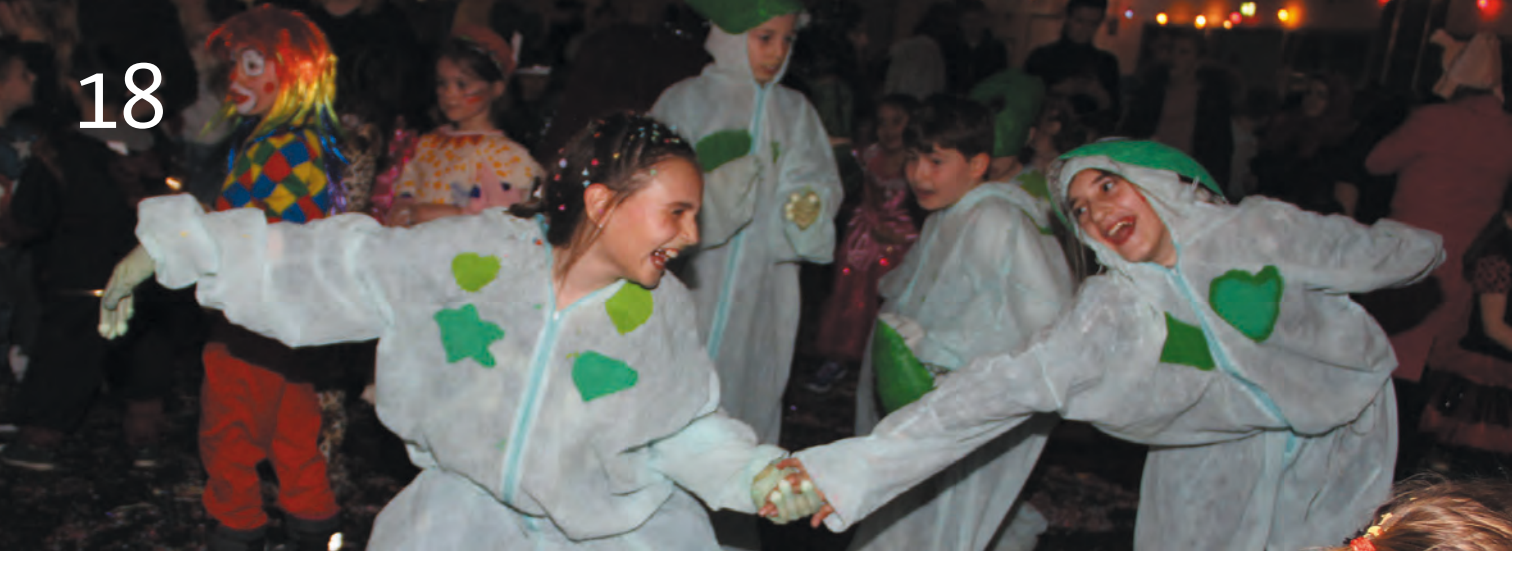
> © 2019 Christine Schwarz